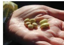
大豆ひと粒ひと粒にも愛着がわきます

畑を借り、大豆を蒔き、育て、収穫し、味噌を仕込む—あえて手間をかけた、「手前味噌」作りの連続企画。「大豆を育て、味噌を仕込む」という過程のなかで、耕作放棄や自給率などの課題に気づいたり、参加者同士の交流が深まったりします。作業後半の収穫(11月)、脱穀(12月)、選別(1月)、仕込み(3月)にぜひご参加ください。