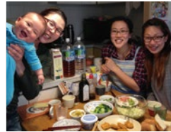
ご関心のあるお友だちとぜひ

オーガニック食材にご関心があるお友だちを誘って、大地宅配の食材で「オーガニックパーティー」をしませんか？ あなたのおすすめの食材をお召し上がりいただきながら、一緒に大地宅配の輪を広げましょう♪