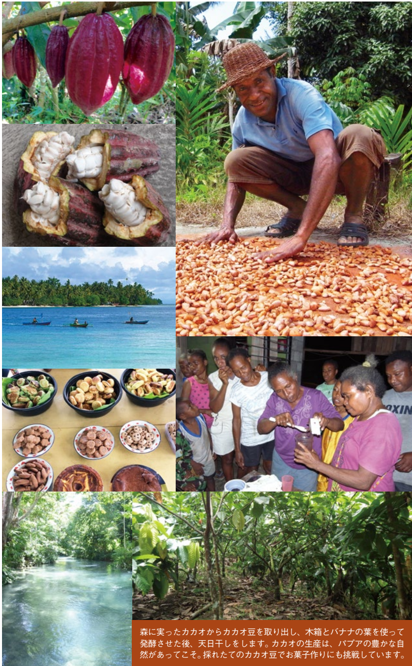
森に実ったカカオからカカオ豆を取り出し、木箱とバナナの葉を使って発酵させた後、天日干しをします。カカオの生産は、パプアの豊かな自然があってこそ。採れたてのカカオ豆でお菓子作りにも挑戦しています。

1950年代から60年ごろ以来、カカオ栽培はパプアの人たちの生活の一部になりました。カカオの原産地ともいわれる中南米や、日本への輸入量が多いアフリカに比べると、アジアのパプアは「カカオのニューワールド」とも呼ぶべき地域です。