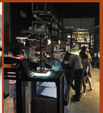
リーフ柄のデザインが印象的な「パラダイスパプア・クラフトチョコレート」(写真左)。パプアにあるスタイリッシュな内装のサードウェーブコーヒー専門店(写真右)。