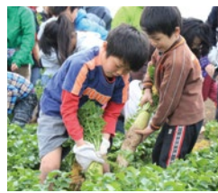
子どもたちもたくましく活躍します

相模湾が一望できる広い畑での楽しい大根の収穫体験です。大きな大根も意外に簡単に「スポン!」と抜けて、子どもたちも大喜び。収穫体験後は三浦のお母さんたち特製の大根汁で、身も心も温まります。たくさんの大根を抜いて収穫のお手伝いをしてみませんか。