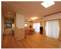
木の香りがする居心地の良いリビングです

リフォーム工事が完成して1年が経ち、以前と比べ住み心地はどう変化したのでしょうか？ 大地を守る会の自然住宅でリフォームされた方の生の声を聞くことができるだけでなく、床暖房の温かさや自然素材の心地良さを体感いただくことができる貴重な機会です。ぜひご参加ください。