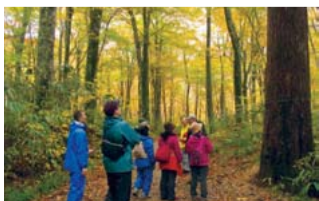
これまで約2万本のブナを植栽。

米どころ秋田県大潟村の水源地である五城目町馬場目川上流に森林を再生しようと、大潟村の生産者の呼びかけで始まった植栽イベント。初期に植えたブナは立派に成長し、広葉樹の森にもなっています。植栽後は、バーベキュー交流会やコンサートも行います。