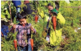
立派に育った野菜にみんな夢中です。

標高約800mという群馬県の倉淵町に位置するくらぶち草の会。春〜秋を中心にほうれん草や大根などを出荷しています。畑仕事が落ち着く11月に、今年も収穫祭が開催されます。野菜の収穫体験、BBQ、お餅つきなど盛りだくさん！収穫の秋を楽しみましょう。