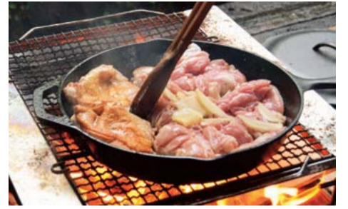
大地を守る会の食材を使ったたき火料理。