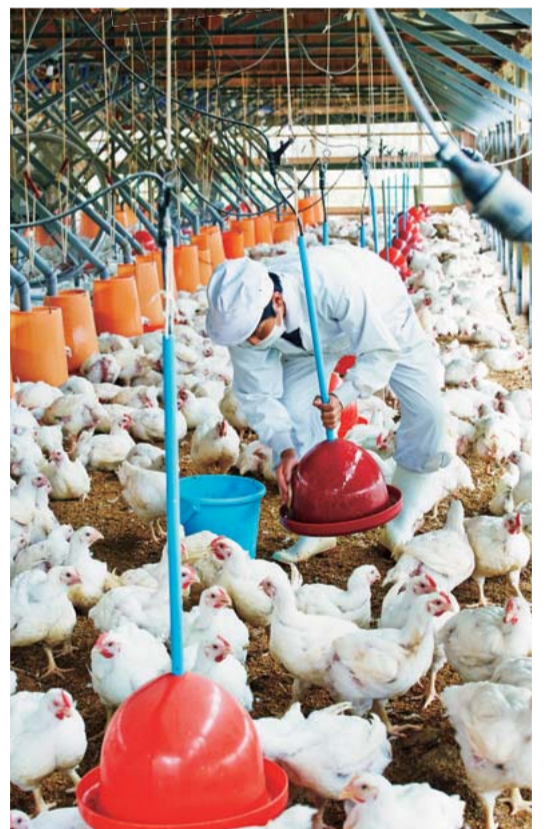
いつもお世話するスタッフなら逃げずに落ち着いている鶏たち。

近年、「アニマルウェルフェア」という考えが世界的に注目されています。アニマルウェルフェアとは、簡単に言えば、家畜ができるだけストレスなく、自由に、健康に生きること（※詳しくは左項コラム参照）。まほろば