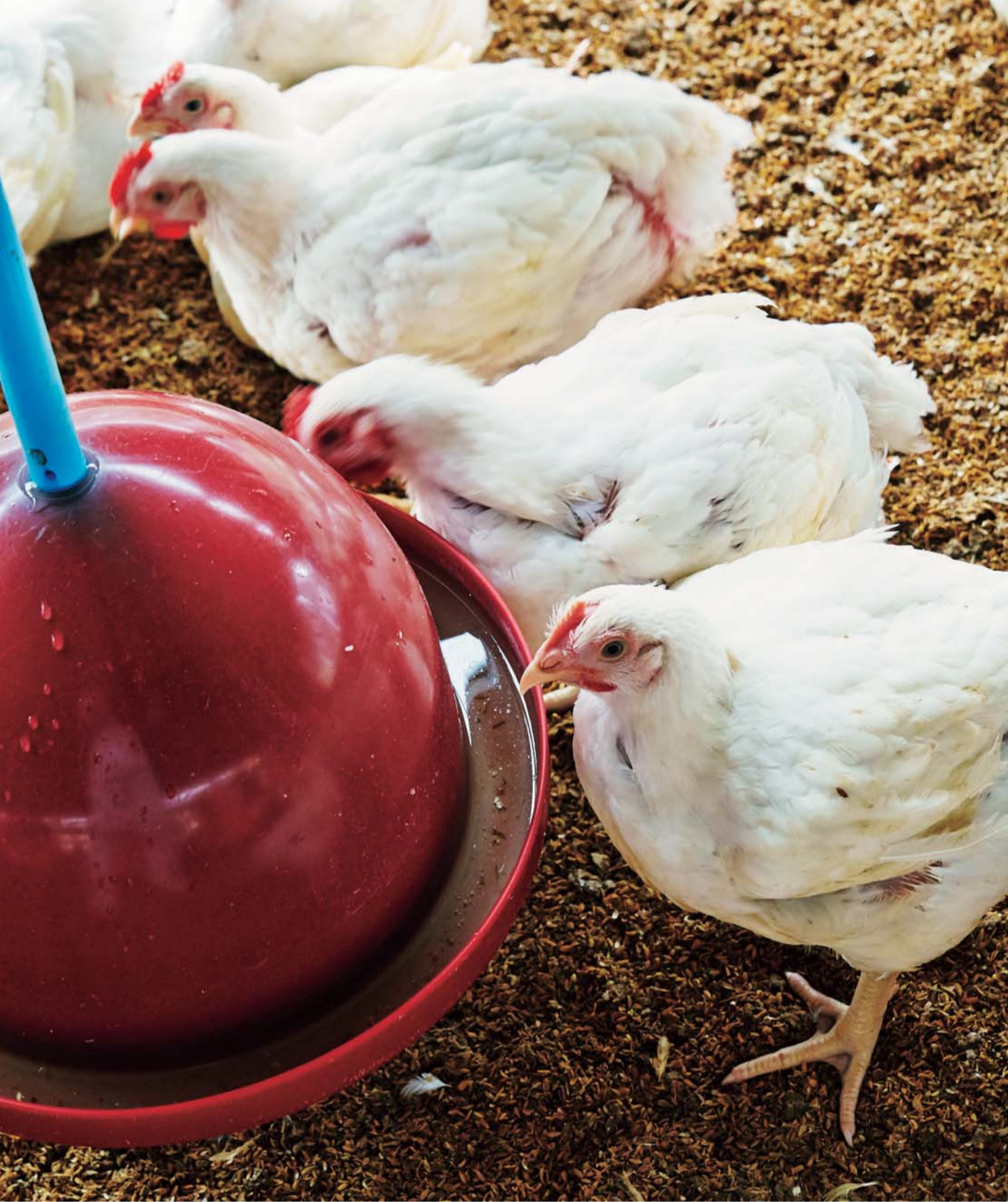
風と日差しが入り、床は籾殻でふかふか。水を飲んだり好きな場所に行ったりと、鶏たちは自由に過ごします。