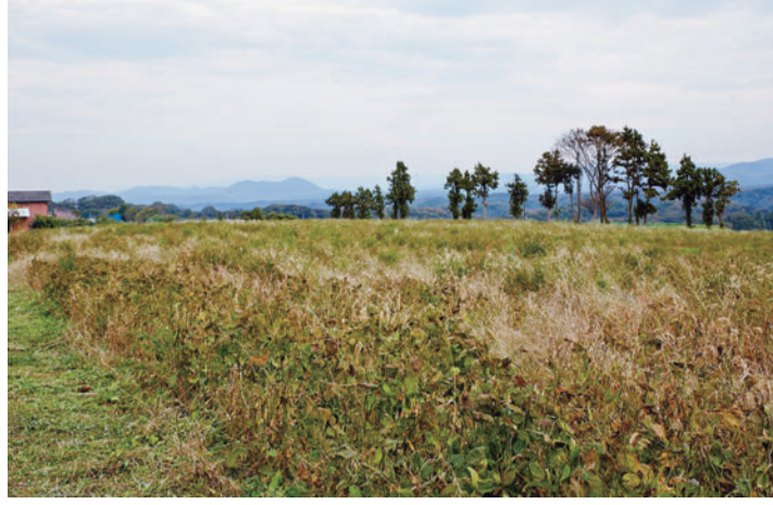
山間に点在する畑は、形がまちまちだったり石が多かったりと手入れが大変です。