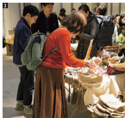
1 生産者自慢の食材がずらり。 2 交流パーティーでは、大地を守る会の食材などを使った料理と飲み物を片手に。 3 生産者と楽しくおしゃべり。