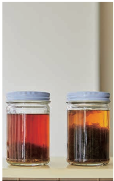
スーパーでよく見かけるのりの佃煮(左)と、遠忠食品の佃煮(右)を比較。のりの含有量の違いがはっきり。