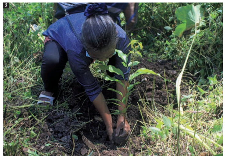
1 今後の洪水被害を最小限に抑えるために近郊の山々に木を植えています。 2 仕事を失った方々に仕事として植林をお願いしています。 3 常緑樹、果樹、柑橘の苗木を選び、土地の用途に合わせて植えます。 4 4月の豪雨で水没した首都ディリの様子。