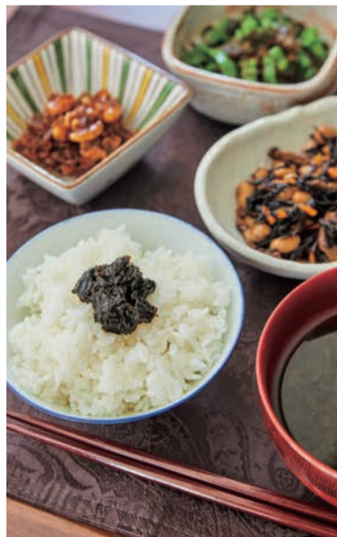
スープはのりの佃煮をお湯で溶いて、少しだしを加えたもの。佃煮のおすすめアレンジ法の一つだ。