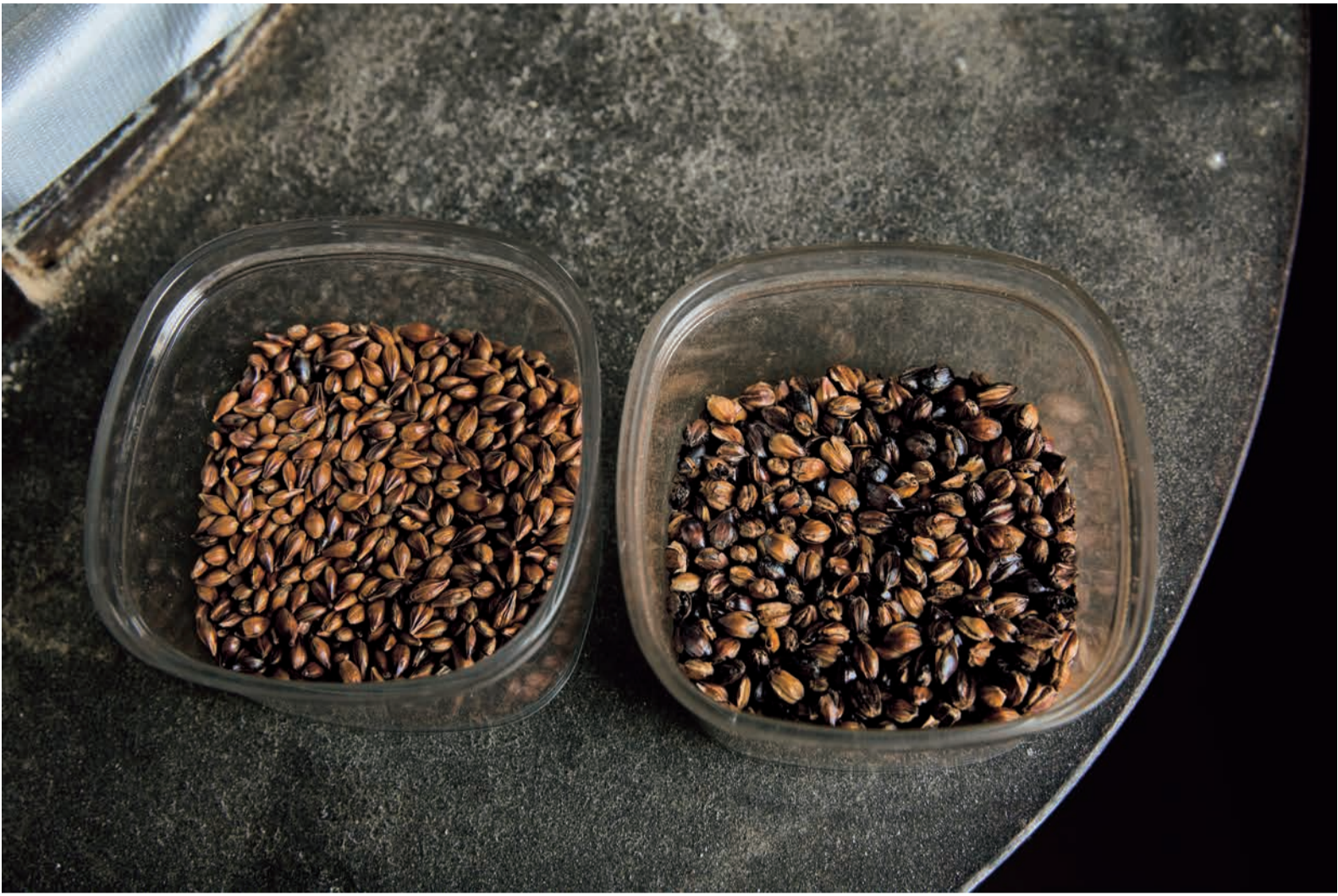
左が熱風、右が砂釜焙煎の麦茶。砂釜の方は粒が大きく膨らんでいるのが分かります。