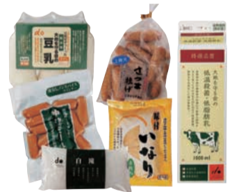
お届けする商品例

※同時配布の「カタログ大地を守る」とお買い物サイト134号を合わせてご覧ください。