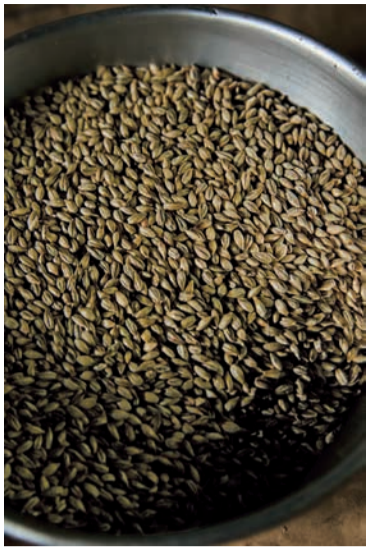
麦茶は籾殻に覆われた大麦の玄麦を煎って作られます。最初はこんな姿。この段階では色も強く強い香りもありません。原料は大地を守る会の生産者、仙台黒豚会（宮城県大崎市）と古代米浦農園（群馬県藤岡市）の大麦。