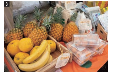
1 消灯後のミニステージ。一夜限りのライブの美しい歌声に会場は一体感に包まれました。 2 大地を守る会の生産者が出店したマルシェブース。ご来場の皆さんで賑わいました。 3 大地を守る会のマルシェブースでは、旬の青果やオリジナル商品を販売しました。