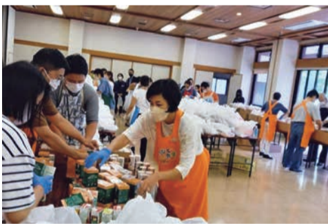
支援団体でのフードパントリー開催準備の様子。お米やレトルト食品などが喜ばれます。

※募金にポイントを ご利用いただくことはできません。 ※募金は送料算出時の 「ご注文金額」には含まれません。