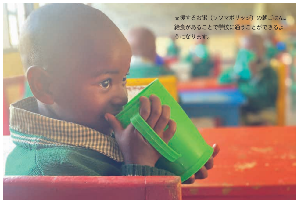
支援するお粥(ソソマポリッジ)の朝ごはん。給食があることで学校に通うことができるようになります。

開発途上国の飢餓と先進国の肥満や生活習慣病に同時に取り組む活動です。大地を守る会でも寄付金付き商品の販売を通して開発途上国の子どもたちに給食を届ける活動を支援しています。TFT対象商品1品につき、売り上げの3%がTFTに寄付され、20円の寄付で温かい給食1食分がケニア、タンザニア、ルワンダ、フィリピンの支援先に届きます。