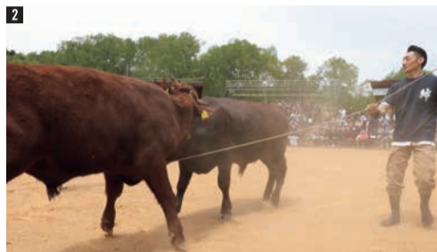
1 広々とした牧野で放牧の様子を見学します。子牛たちが元気に駆け回る姿は感動もの。 2 迫力のある闘牛大会わかば場所。山形村短角牛の生産者も活躍します。