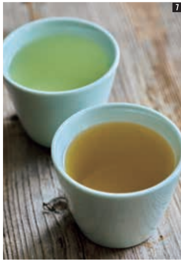
5 6 蒸し上がった1.5トンの米を甑(こしき)から取り出して乾燥工程のベルトコンベアへ。きれいに麹菌が入っていくように「外硬内軟」に蒸し上げることが大切です。「ここがうまくいけば全部うまくいく」という大事な工程。7 手前が新しい料理酒で奥が旧料理酒。色がだいぶ異なるのが分かります。