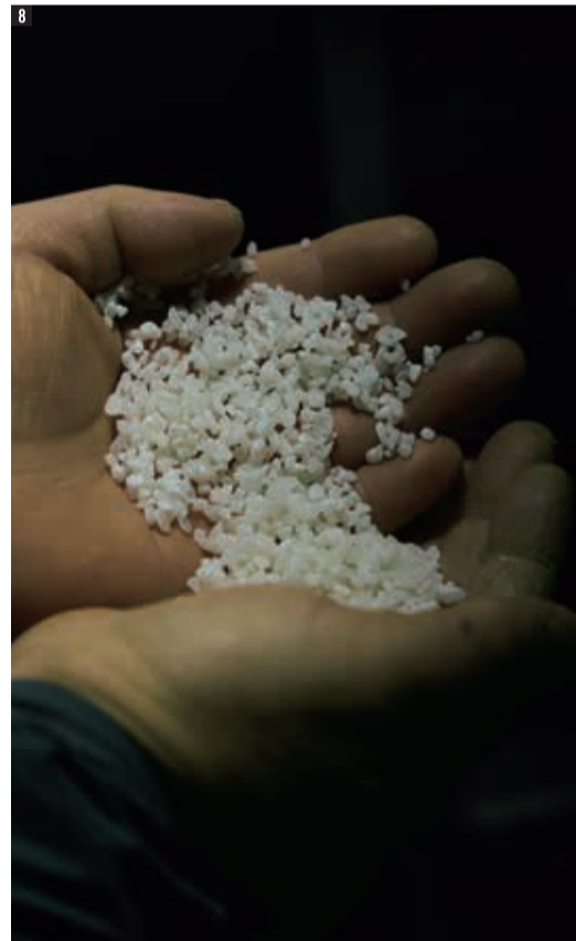
8 種麹を振りかけて24時間経過して麹菌を繚り始めた米麹。この米麹を日本酒よりも多く使うため甘み、うまみの濃い酒になります。9 蒸し上がった米は粒が立っているため、精米をやさしくしたり、浸漬時間を短くしたりと、その年ごとに「今年の米に対してできること」を尽くします。10 酒の母と書いて「酒母(しゅぼ)」。こちらは吟醸酒のもので白っぽい色味ですが、料理酒になると琥珀色寄りになります。