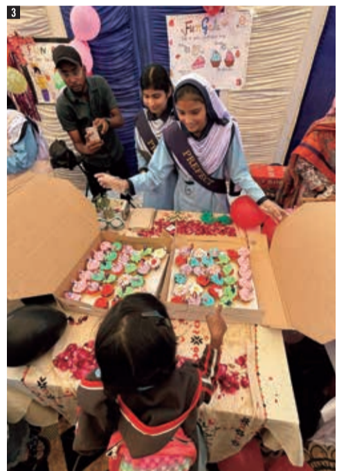
1 学びたいから学校へ行く。子どもたちはいつでも元気いっぱい。 2 アルカイル工科専門学校では、同アカデミーで学んだ生徒が先生となっていました。3 手作りのお菓子や小物を生徒同士で売り買いする買い物イベントの様子。