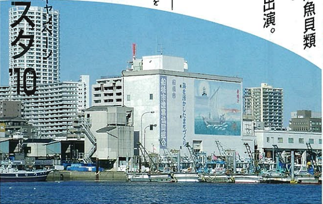
会場:日の出1丁目船橋漁港、船橋ポートパーク横